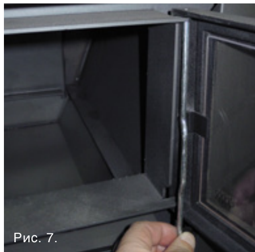
Рис. 7. Откройте дверцу, поднимите шток петли настолько, чтобы он вышел из нижнего держателя петли. Удерживая дверцу, поверните дверцу и нижний конец штока на себя так, чтобы можно было вытянуть шток, что позволит снять вместе с ним и дверцу. Установка дверцы выполняется в обратном порядке. Установите дверцу на место и вставьте шток петли в верхний держатель петли. Совместите шток с нижним держателем и вставьте его в держатель. Сплюснутый конец штока должен быть обращен вниз для того, чтобы исключить его выход из держателя. Для того чтобы облегчить работу, пользуйтесь тонкогубцами.